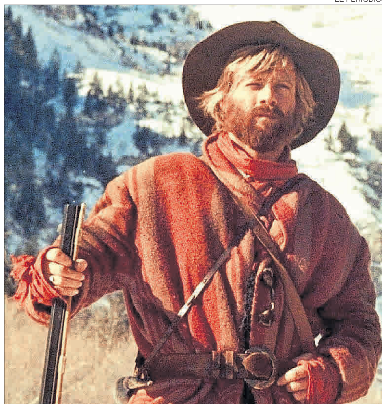
► Una imagen de la película 'Las aventuras de Jeremiah Johnson'.