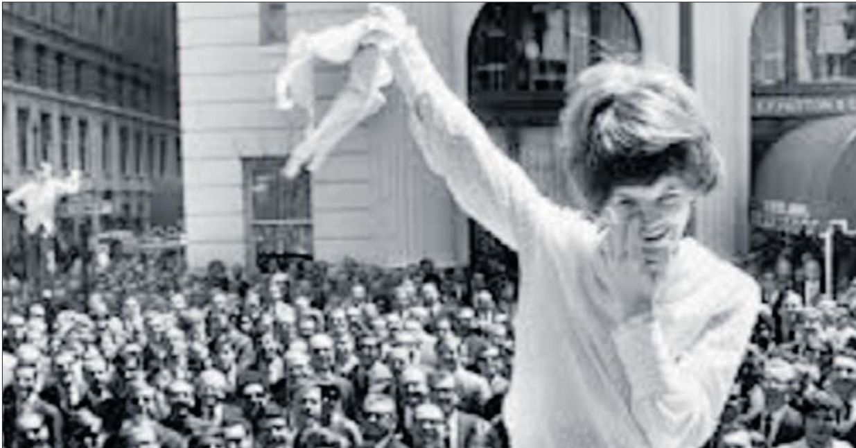
Una joven se quita el sujetador durante una protesta en Londres en 1963.

► El Prado es todavía, doscientos años después, una institución en la que se silencia y se excluye a la mujer. A las artistas y a las visitantes: todas invisibles y todos ciegos ante la ausencia de la voz y la experiencia femeninas. ¿Por qué el Prado ignora a las mujeres? En las salas del referente español y en las del resto de instituciones internacionales, el relato que se alaba en el siglo XXI es el mismo con el que el siglo XIX contó el mundo y construyó sus intereses. Cuadro a cuadro, este libro revisa el legado patriarcal que ha llegado hasta nuestros días.