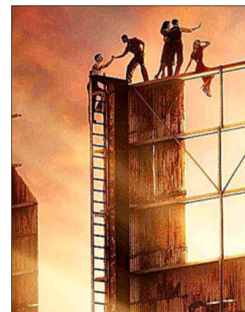
Fotograma de 'Hollywood'.

Tres Globos de Oro en 2016 avalan a esta miniserie de la BBC sobre uno de periodos más inestables y apasionantes de Inglaterra: principios del siglo XVI, cuando Enrique VIII se encuentra con el país al borde de una guerra, sin heredero y con la intención de anular su matrimonio para casarse con Ana Bolena, una idea a la que se oponen el Papa y media Europa. Basada en el superventas Trilogía Thomas Cromwell de Hilary