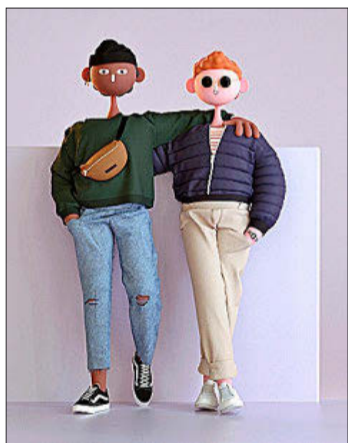
Ilustración del dúo Cabeza Patata.

Le Rhinocéros de Veilhan, New York City de Mondrian o Big Electric Chair de Warhol. En Prisme 7, que el Pompidou presenta como su primer videojuego (aunque es más bien una aplicación educativa), se puede jugar con 40 obras del museo y perderse por el laberinto de tubos del edificio concebido por Renzo Piano y Richard Rogers. La