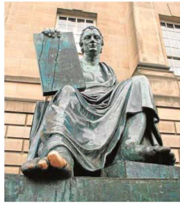
CREENCIA. La estatua de Hume en Edimburgo. Dice la leyenda que todo estudiante que toque su dedo adquiere la sabiduría del filósofo escocés

RELATIVISMO MORAL. Esta distinción implica cuestionar la validez universal de las ideas y la propia autonomía de la razón, que está supeditada a las impresiones temporales y dispersas de nuestra percepción. Hume afirma que «las ideas no son más que copias de nuestras impresiones o, en otras palabras, nos resulta imposible pensar en nada que no hayamos sentido con anterioridad». Por ello, la