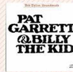
Bob Dylan Pat Garrett & Billy The Kid (1973)

Solo tengo una cosa que decir: El disco de mi adolescencia. Y punto.