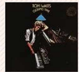
Tom Waits Closing Time (1973)

Mi padre es un gran fan de Tom Waits y acabé metido curiosamente en estos dos discos. Sé que no son grandes éxitos en su discografía, pero siguen siendo mis favoritos. Se había suavizado un poco, pero incluso los momentos abrasivos suenan realmente bien.