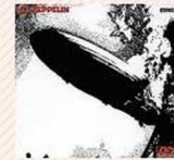
Led Zeppelin Led Zeppelin (1969)

Reconozco que hay algo de placer culpable en mi gusto por Everything But The Girl . También es terapéutico. La voz de Tracey Thorn me relaja tanto como el whisky. La escucharía aunque hiciera un audio-libro de las páginas amarillas.