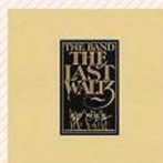
The Band The Last Waltz (1978)

Su disco de debut es mi favorito entre los de Waits; entre otras razones, porque aún no se le había roto la voz y adquirido su característico tono aguardentoso (aunque haya algo sacrilego en decirlo).