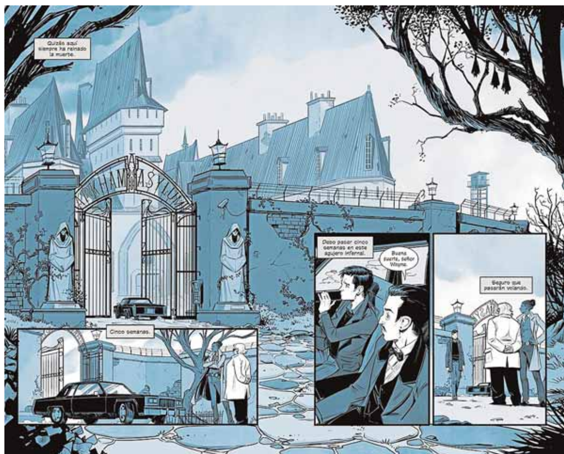
Bruce Wayne pasará a realizar trabajos sociales en el conocido Asilo Arkham.