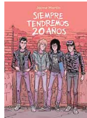
SIEMPRE TENDREMOS 20 AÑOS

Aunque la serie de televisión estrenada en 2018 no tuvo la repercusión esperada (fue cancelada en octubre de 2019), Capa y Puñal son un interesante tándem de superhéroes que merecen un hueco en nuestras estanterías. Para ello, Panini ha decidido recopilar en un solo tomo la saga que se publicó a finales de los 80 donde el guionista original, Bill Mantlo, da el relevo a un Terry Austin que incorpora nuevas ideas. Un cómic lleno de acción que nos hace viajar a la etapa dorada de este extraño dúo de héroes.