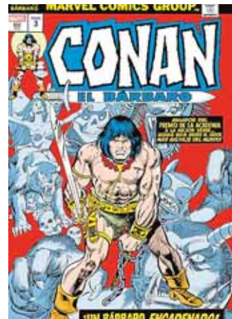
CONAN EL BÁRBARO. LA ETAPA MARVEL ORIGINAL 3

Miguelanxo Prado lo ha vuelto a hacer. Ha vuelto a crear un cómic cautivador de principio a fin que profundiza en las creencias innatas del ser humano: la mitología y la magia. Ambientado en el norte de España, el título narra el despertar de un grupo de seres protectores de Gaia que se enfrentarán entre sí: unos desean acabar con la humanidad mientras que los otros la protegerán. Una sobrecogedora historia de aventuras, con un dibujo espectacular, que demuestra por qué el autor tiene en su haber tantos galardones.