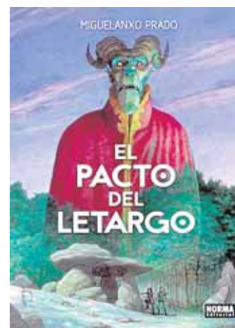
EL PACTO DEL LETARGO Miguelanxo Prado. 104 págs. 23 euros. Norma Editorial

Miguelanxo Prado lo ha vuelto a hacer. Ha vuelto a crear un cómic cautivador de principio a fin que profundiza en las creencias innatas del ser humano: la mitología y la magia. Ambientado en el norte de España, el título narra el despertar de un grupo de seres protectores de Gaia que se enfrentarán entre sí: unos desean acabar con la humanidad mientras que los otros la protegerán. Una sobrecogedora historia de aventuras, con un dibujo espectacular, que demuestra por qué el autor tiene en su haber tantos galardones.