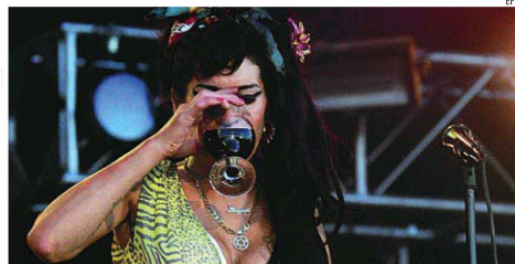
La autora cita a numerosos artistas en su obra, como es el caso de Amy Winehouse

El libro de Jamison transcurre en medio de su adicción por el alcohol, su corolario y la leyenda que gravita sobre la «literatura de los borrachos». Antes de los 20 años bebió hasta lo que Hemingway emplazaba como ron valiente o Lowry tildaba de tequila sin miedo. El licor hizo que todo fuera más nítido, hasta que dejó de hacerlo... Por lo que la autora nos explica lo que supuso el encanto de la autocompasión y la falacia patética que dinamitó su delirio como narradora «etilizada». Su mente interpretaba cualquier problema ordinario como un conflicto épico o una conspiración contra su integridad. Es la tendencia del «creador adicto»: inflar cualquier contratiempo hasta convertirlo en justificación de su compulsión para mutar a mito literario. El alcohol, erróneamen-