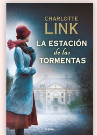
La estación de las tormentas.

Estamos, en definitiva, ante una magnífica obra donde el autor consigue exhibir la parte más sombría del hombre a través de personajes carentes de alma y donde se nos muestra una realidad total. Un thriller que nos lleva a un momento cargado de historia, y que te hará ver la guerra civil como nunca te la han mostrado.