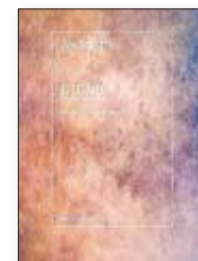
ALI SMITH Otoño

El libro los compara con Próspero y su hija Miranda, en 'La tempestad' de Shakespeare; como Miranda, Elisabeth todavía está esperando que su futuro se abra para ella.