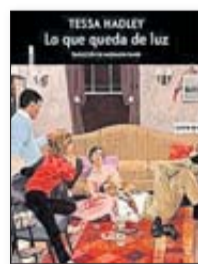
TESSA HADLEY Lo que queda de luz

El detonante llega cuando Zachary muere de repente de un ataque al corazón en su galería de Clerkenwell. El grupo pierde su