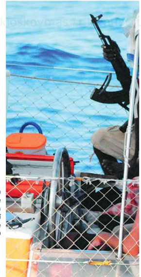
Esta foto muestra el secuestro de una embarcación en la costa somalí por piratas de ese país en 2009

sional sobre piratas somalíes o vertidos masivos de petróleo», escribe Urbina, que viajó cuarenta meses y atravesó 400.000 kilómetros por los cinco continentes, más 12.000 millas náuticas a lo largo de cinco océanos y veinte mares. A partir de una primera experiencia en Singapur, en el tiempo en que estaba preparando su tesis en Chicago como marinero de cubierta y antropólogo residente en un buque de investigación, entendió que desplazar mercancías por mar es más económico que por aire al carecer de burocracias y tener menos normas. Eso ha dado pie a innumerables ilegalidades, desde el fraude tributario al almacenamiento de armas: así, por ejemplo, el Gobierno de EE UU «eligió las aguas internacionales para desmantelar el arsenal de armas químicas de Siria, para algunos de los encarcelamientos e interrogatorios relacionados con el terrorismo o para deshacerse del cadáver de Osama bin