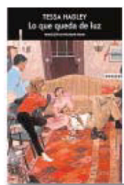
Lo que queda de luz Tessa Hadley

tos, siempre confusos, se intercalan en las páginas de esta novela en la que dos parejas (Alex y Christine, y Zachary y Lydia) tejen y destejen los hilos emocionales, hasta quedar confundidos en el desorden de su propia madeja. Como espectadores, sus hijos, secundarios de lujo a los que Hadley confiere el don de la empatía narrativa, sin renunciar, eso sí, a hacerles sentir, sufrir, al son de sus progenitores, incluso cuando la vida parece detenerse. Cosa que sucede la noche de un verano cálido, sin el sueño de Shakespeare, en la que Zachary, el más encantador de todos ellos, el que menos lo merecía, muere, repentinamente, y les deja sumidos en el desconcierto de sus descontrolados afectos.