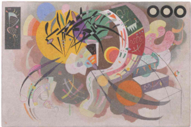
Courbe dominante (1936), una de las obras de la exposición Kandinsky en el Guggenheim Bilbao.