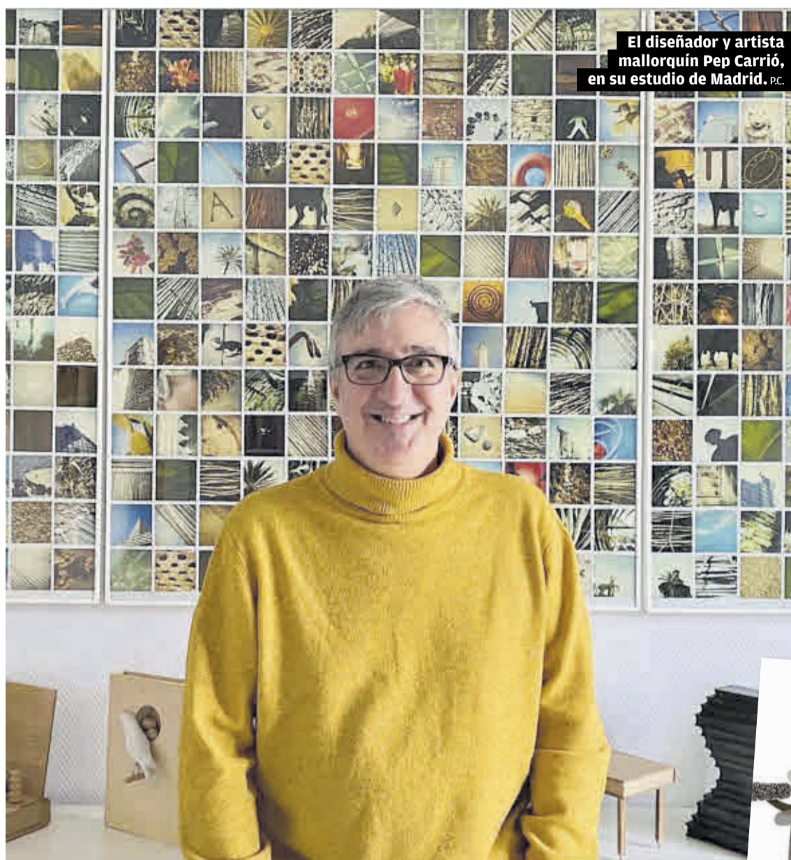
El diseñador y artista mallorquín Pep Carrió, en su estudio de Madrid. P.C.