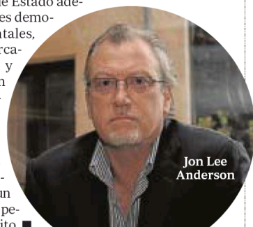
Jon Lee Anderson

« LOS AÑOS DE LA ESPIRAL » RECOGE medio centenar de reportajes y artículos que Anderson ha publicado en The New Yorker . Y aunque estas compilaciones siempre corren el riesgo de resultar machaconas o desfasadas, nada de esto ocurre aquí porque las crónicas de Anderson tienen el equilibrio justo entre información, sin dogmas ni prejuicios, y un vuelo literario que las hace perdurar. Colombia, Bolivia o Panamá son algunos de los países retratados por Anderson y Noriega, López Obrador o Leonardo Padura los protagonistas de sus reportajes. Los «años de la espiral», llamados así por ser «un periodo confuso, de golpes y sucesos inesperados, sin rumbo fijo», comenzaron con Chávez decadente, incapaz de sostener su revolución bolivariana con una estructura de Estado adecuada a los estándares democráticos más elementales, siguieron con el acercamiento de Cuba y EE.UU. y se cerraron con el giro a la derecha populista de Trump y el brasileño Bolsonaro. Anderson relata estos reajustes con el pulso de un historiador, el nervio de un narrador y el tino del periodismo más exquisito. ■