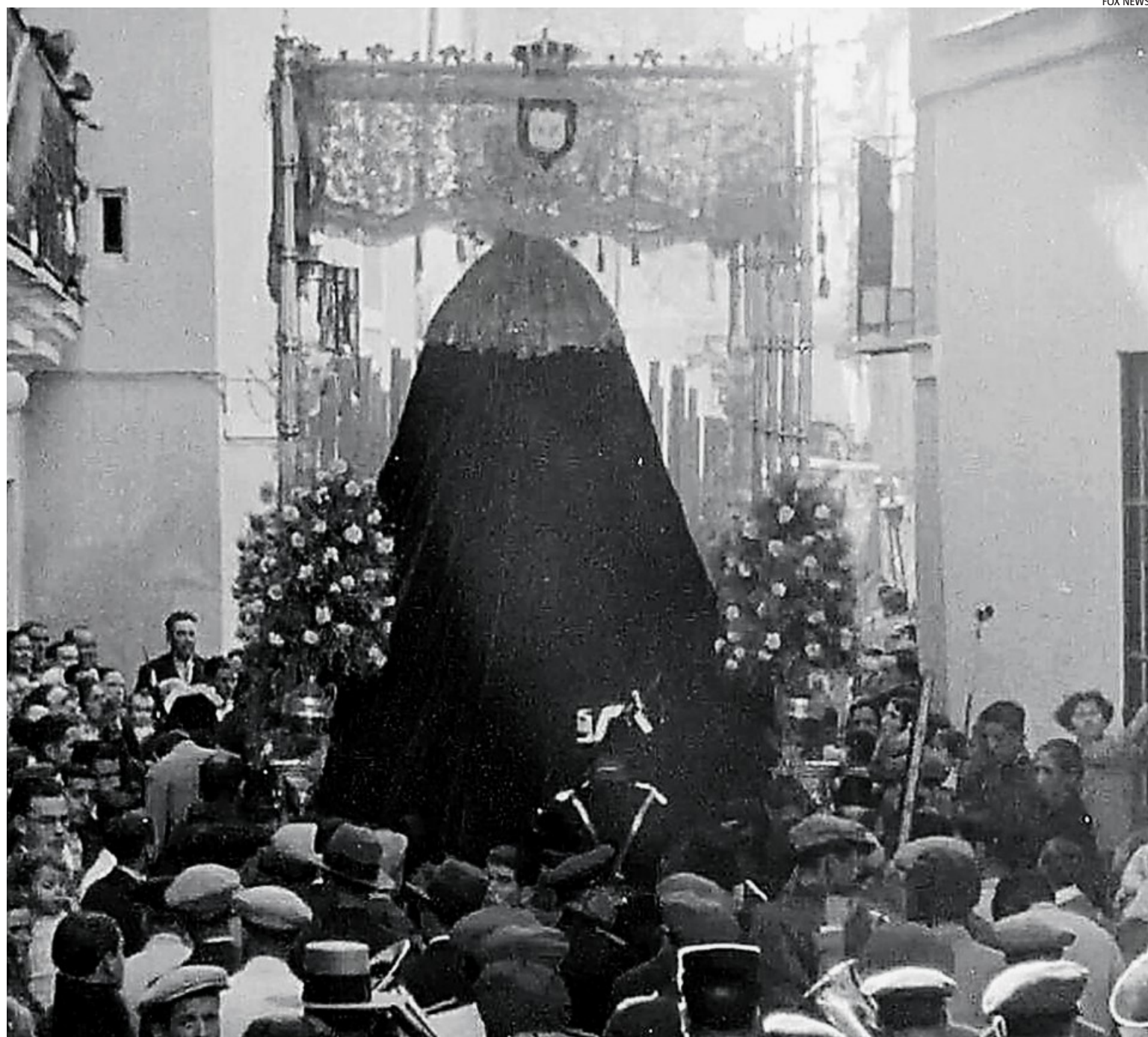
Una de las imágenes de la película descubierta sobre la Semana Santa en la ciudad hispalense muestra el paso de la Virgen de la Macarena

Para evadirse del ambiente lúgubre y ciertamente deprimido que invade la ciudad universitaria donde comienza a cursar sus estudios, el joven John Kemp decide inventarse un romance con una chica anónima. A medida que transcurre su estancia, el protagonista de este pequeño clásico ambientado en los primeros años de la II Guerra Mundial y escrito por el poeta inglés Philip Larkin, quien, en tono autobiográfico, se sumirá en una espiral de autodestrucción, obsesiones insanas e inesperados acontecimientos.