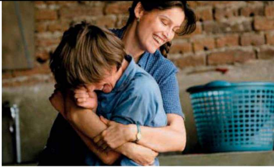
De izda. a dcha., buenas historias para todos los gustos: Una veterinaria en la Borgoña , El horizonte (Le milieu de l'horizon) , El olvido que seremos , Becky y Minari. Historia de mi familia .