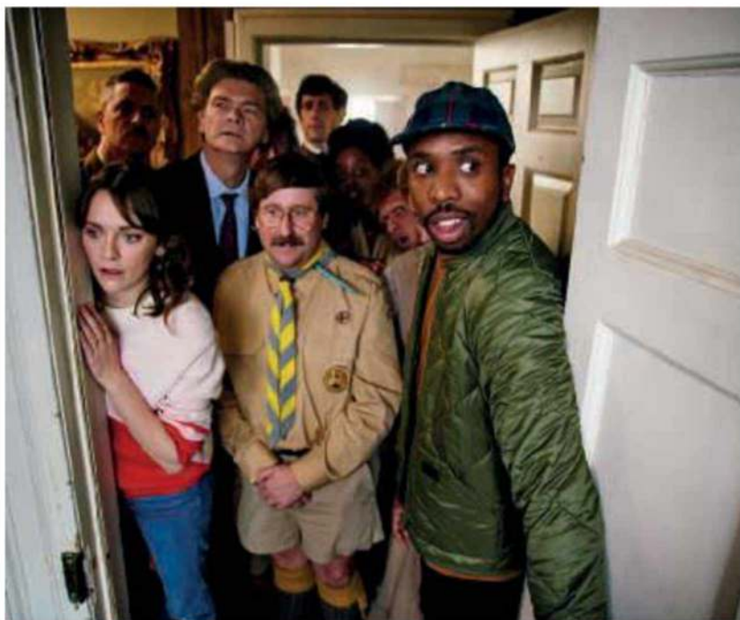
Hay fantasmas que despiertan muy poco miedo, pero sí muchas sonrisas.

humor negro (estreno directo ya en Movistar+). Para los amantes del cine independiente, la triunfadora del Festival de Sundance: Minari. Historia de mi familia , con una familia de origen coreano que busca el sueño americano en una granja de Arkansas (estreno: 12 de marzo). Y Una veterinaria en la Borgoña , que pondrá a prueba a una recién licenciada para que se quede en el pueblo donde nació, aunque no le apetezca en absoluto (estreno: 26 de marzo).