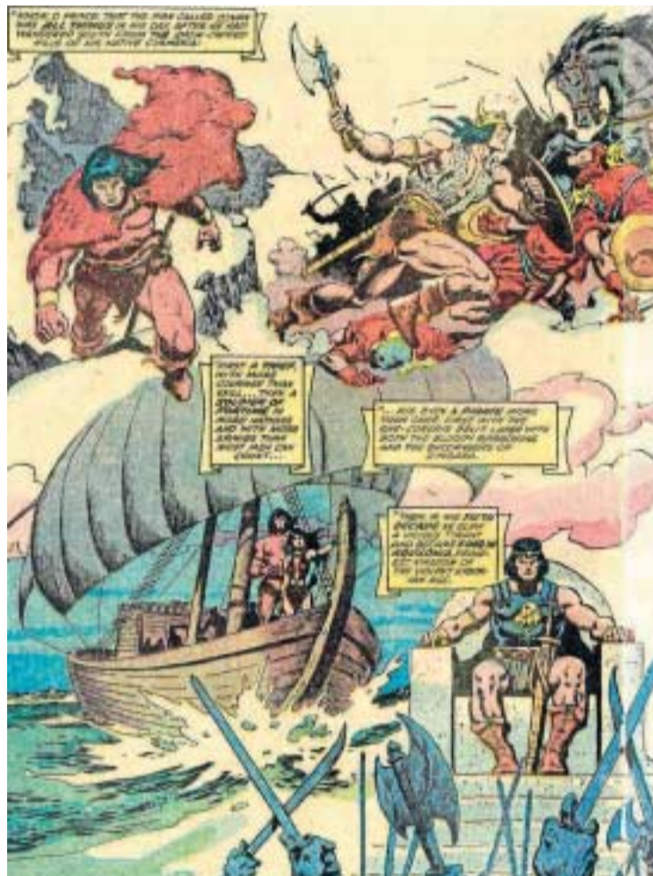
Una viñeta incluida en el libro de Francisco Calderón.

Con el regreso de Conan a Marvel, se ha multiplicado la presencia del bárbaro en librerías. A las varias series y miniseries ambientadas en la era Hiboria, se suman una línea de aventuras junto a los Vengadores, eventos superheróicos centrados en su imaginaria y hasta versiones futuristas del cimerio. El balance artístico general, para qué negarlo, está siendo pobre, y da la sensación de que, más allá de la voluntad de inundar el mercado para insuflar popularidad a la franquicia, la editorial neoyorkina no sabe realmente qué hacer con Conan. Caso aparte son las magníficas reediciones del material clásico que Marvel ha venido ofreciendo sin descanso (en España, las edita Panini). Estos tebeos se han publicado ya mil veces y en toda clase de formatos, pero nunca de esta forma tan respetuosa con el material original. Aquel Conan de Marvel (el de los años setenta, ochenta y noventa, muy especialmente el de la primera de estas tres décadas) es uno de los mejores tebeos producidos por Marvel a lo largo de su historia y goza de un cariño incondicional por parte de los aficionados.