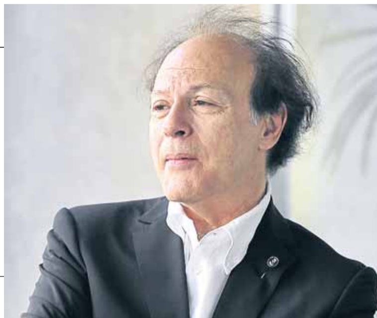
El escritor madrileño Javier Marías.

vidades para el MI6 y el MI5, aunque con un sueldo del Foreign Office que se gana en un despacho de la embajada británica en la capital de España y que supo-