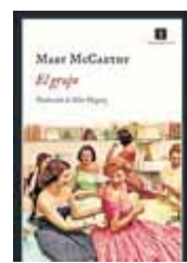
EL GRUPO MARY MCCARTHY

Publicada a comienzos de los sesenta, 'El grupo' causó un gran escándalo. Su autora era una de esas chicas bien del exclusivo Vassar College y hablaba en primera persona de la vida de las mujeres que en aquel momento eran algo así como las madres ideales que recibían cada tarde con una copa a sus maridos triunfadores. Incluso un tipo duro como Norman Mailer se escandalizó y realizó una reseña del libro que ha pasado a la