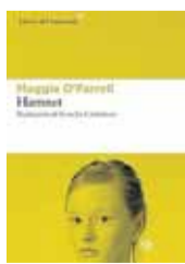
HAMNET MAGGIE O'FARRELL

chísimos para la época y para una mujer), tres hijos. Dos chicas y un chico, este llamado Hamnet. Sabía que el dramaturgo se ausentaba durante largo tiempo de su ciudad natal, Stratford, para residir en Londres donde triunfaba como actor y dramaturgo. Pero ignoraba que Hamnet había muerto a los once años, sobreviviéndole sus dos hermanas, ninguna de las cuales tuvo hijos, y por tanto la estirpe de los Shakespeare se interrumpía con ellas. Ahora sé mucho más de la vida del autor de 'Hamlet', gracias a la autora norirlandesa Maggi e O'Farrell. Y, sobre todo, gracias a su novela 'Hamnet', premio Women's Prize for Fiction.