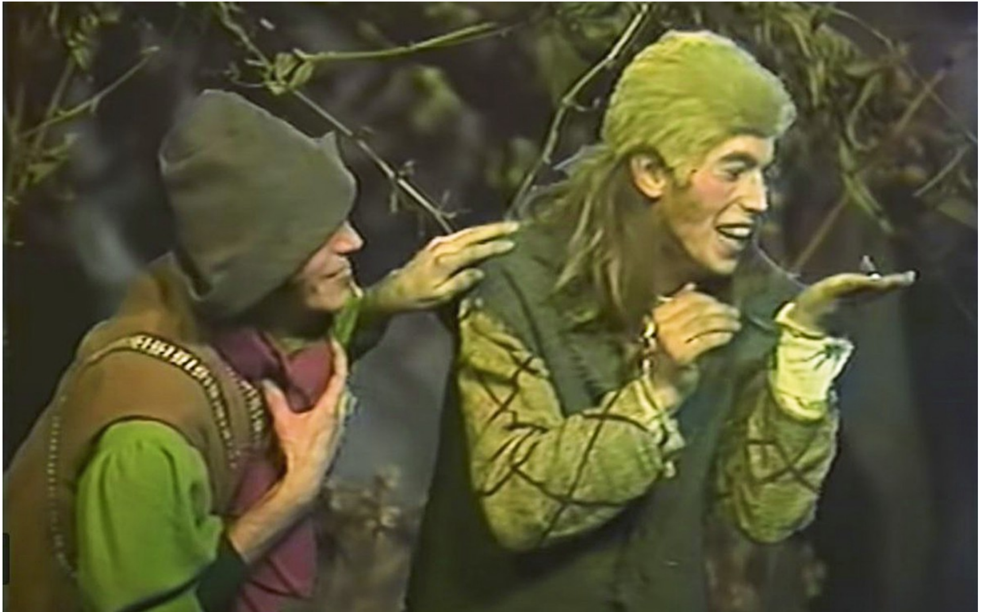
Una imagen de «Guardianes», título en ruso de la adaptación de la trilogía de J. R. R. Tolkien

nombre de Jill. A partir de ese momento, comenzará una espiral obsesiva sobre ella hasta que los acontecimientos experimentan un giro inesperado. Su vida y sus aspiraciones, así como sus deseos y anhelos darán paso a un relato poético y grandioso de uno de los maestros de la literatura inglesa de los años cincuenta.