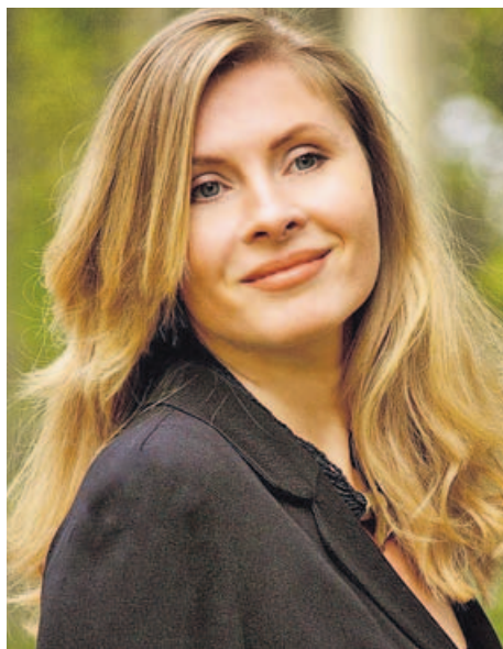
La autora rumano-moldava, antes periodista en Rumanía, reside en París

—Esta novela es todavía un paso más oscura. Más dura. ¿Huye de la amabilidad porque sí? ¿Le atraen las imperfecciones?