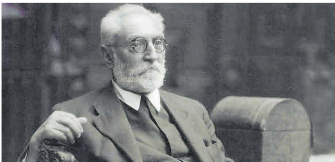
► Miguel de Unamuno.

Casas asoladas por plagas de comadrejas. Pasillos que nos llevan al otro lado, como si una Alicia hubiera ido a caer en el Japón actual. Hiroko Oyamada, con mundos que parecen sacados de un relato de Murakami, firma un tríptico narrativo sobre la sugerente idea de que el entorno que nos rodea puede anticipar nuestras emociones y hasta nuestro destino.