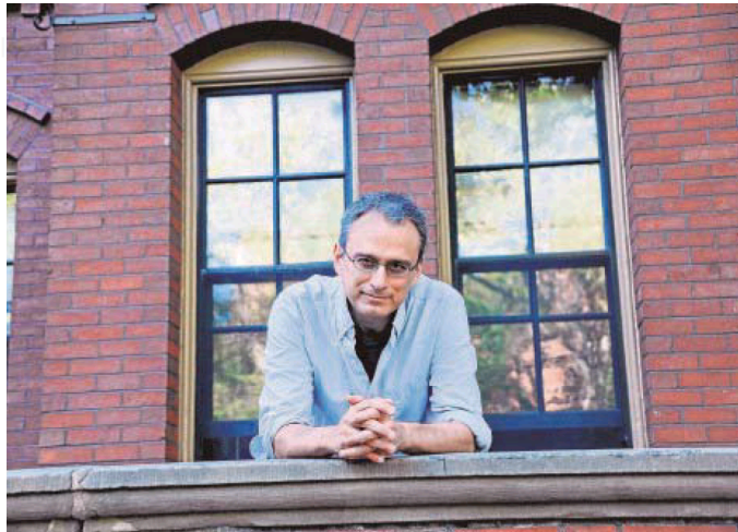
William Deresiewicz es un ensayista y crítico literario norteamericano

William Deresiewicz retrata un presente y un futuro incierto para los creadores contemporáneos vendidos a la 'frikada'