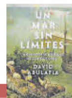
'UN MAR SIN LÍMITES' David Abulafia | Crítica

En el edificio del título se alojaron los principales dirigentes e intelectuales soviéticos. La mayoría de los cuales acabaron pulverizados por las purgas de Stalin. Un libro de historia que se lee como una novela anclada en unos años en los que la Historia no descansaba.