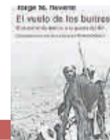
'EL VUELO DE LOS...' Jorge M. Reverte | Galaxia

Autor sobre un ensayo fundamental sobre el Mediterráneo, el británico de origen israelí David Abulafia amplía la óptica a nivel global y relata la historia de la Humanidad a partir de los océanos. La historia de la interacción humana a través de las principales masas de agua del planeta.