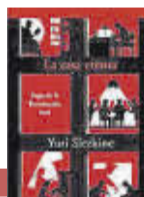
'LA CASA ETERNA' Yuri Slezkine | Acatilado