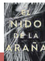
'EL NIDO DE LA ARAÑA' María Frisa | Ediciones B

En 2012, la autora descubrió que el hijo que esperaba sufría un defecto congénito incompatible con la vida. Starobinets narra con extrema dureza y desgarradora humanidad el peregrinaje por las instituciones sanitarias de su país, su posterior viaje a Alemania y el duelo por el hijo.