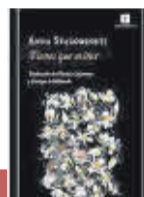
'TIENES QUE MIRAR' Anna Starobinets | Impedimenta

Una parodia de la España actual, un retrato irónico del choque entre el mundo rural y la ciudad del que ya está a punto de publicarse la segunda parte. El aragonés hace un retrato humorístico sobre la realidad actual que funciona incluso por momentos a modo de ensayo.