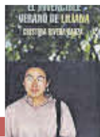
'EL INVENCIBLE...' Cristina Rivera Garza

Crónica del asesinato de la hermana de la autora mexicana a manos del novio de esta. Una investigación, un homenaje, un acto de justicia y un alegato contra los feminicidios que en la época actual ha cogido un gran vuelo y está siendo una de las sensaciones.