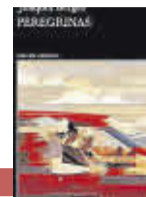
'PEREGRINAS' Joaquín Berges | Tusquets

Crónica del asesinato de la hermana de la autora mexicana a manos del novio de esta. Una investigación, un homenaje, un acto de justicia y un alegato contra los feminicidios que en la época actual ha cogido un gran vuelo y está siendo una de las sensaciones.