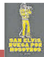
'SAN ELVIS, RUEGA...' Pau Arenós | Univers

El desaparecido autor, la pluma más respetada de la literatura de viajes –con el permiso de Lawrence Osborne– ofreció aquí una hoja de ruta desde las Galápagos hasta Australia sin olvidar los polos. Una obra vívida y poética que recuerda los viajes alrededor del mundo.