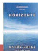
'HORIZONTE' Barry López | Capitán Swing

¿Un libro sobre puertas? Pues sí, eso mismo. Un fascinante ensayo literario que descubre los símbolos y los mensajes que hombres y mujeres han proyectado en las entradas de casas, templos y palacios. Una zona de los edificios que desvelan muchas cosas.