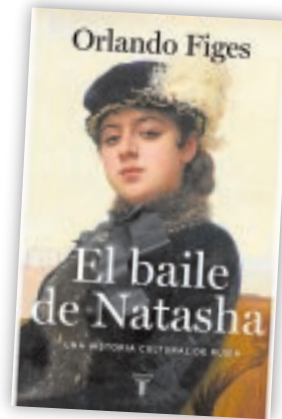
El baile de Natasha (16/09/2021) Orlando Figes Taurus. 736 páginas.