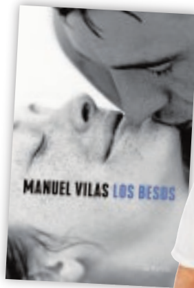
Los besos (31/08/2021) Manuel Vilas Editorial Planeta. 448 páginas.