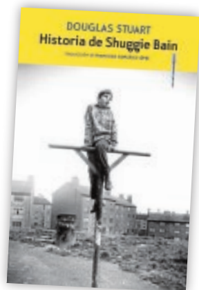
Historia de Shuggie Bain (03/09/2021) Douglas Stuart Sexto Piso. 516 páginas.