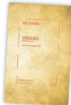
Verano (30/08/2021) Ali Smith Nórdica. 300 páginas.