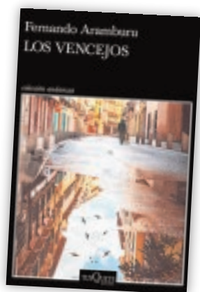
Los vencejos (26/08/2021) Fernando Aramburu Tusquets Editores. 704 páginas.