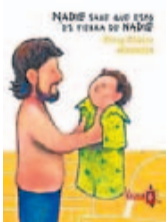
gráfico en el que narra en primera persona, con un tono sencillo y pedagógico los notables cambios que se produjeron en su mente y su vida cuando tuvo noticia de que su pareja estaba embarazada. Un texto que transmite al lector la ilusión, pero el pánico ante la responsabilidad paterna en una sociedad que exalta la juventud como un valor.

Chávez Alzamora es un economista peruano que ha hecho incursiones en la dirección cinematográfica y en la literatura de la autoayuda. 'Nadie sabe que esto es tierra de nadie' es un texto autobio-