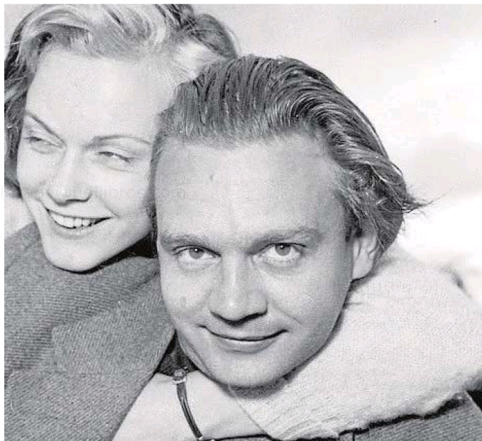
Stig Dagerman (1923-1954) escribió su obra entre 1945 y 1949, de los 21 a los 26 años

Nacido en Älvkarleby, una pequeña población cercana a Estocolmo, Dagerman se crió con sus abuelos en una discreta granja. Una vida, la dura vida rural de trabajo incansable, y un enloquecido «fervor por la tierra» por parte de gente «que podía haber emigrado» pero que escogieron quedarse, cuyo recuerdo nunca le abandonaría. Así lo narraría en un relato autobiográfico. Trasladado a estudiar a la capital, siempre se sentirá ajeno, a mitad de camino: los niños de los campesinos le consideraban un «extrano» y en Estocolmo nunca dejaría de ser «el chico torpe de pueblo». Allí vive con su padre, canteiro del ayuntamiento, de quien adquiere muy pronto el ideario y militancia anarquista. En los años 30, la casa de su padre fue un lugar de encuentro