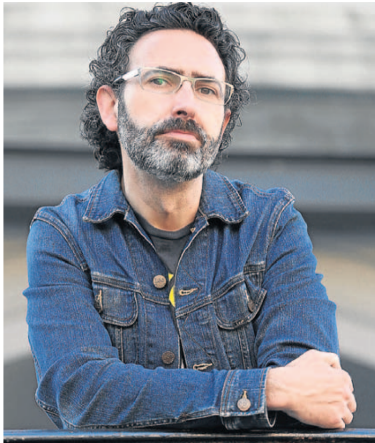
El autor ha situado 'Los extraños' en su casa de Ribadesella. JORDI ALEMANY

– Los protagonistas ven o creen ver unos platillos volantes y tampoco se alteran demasiado.