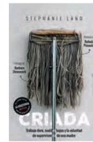
ILUSTRACIÓN: ANA REGINA GARCÍA/COLLAJE; REALIZADO CON EL RETRATO DE LA AUTORA OBRAS DE ASHLEY FARR Y FOTOS DE RICARDO HUBBS/NETFLIX Y GETTY IMAGES.

Creo que sí. Mi hija tiene ahora 14 años y medio y es un ser humano excepcional. El otro día me dijo que cuando era pequeña en el colegio se burlaban de los agujeros de su ropa. Me partió el corazón. Escribir el libro me ha aportado compasión. He aprendido que aquellos años de agujero negro en los que sentía que había fallado no fueron así. He entendido que lo que pasé, o que mi madre me diese la espalda de esa manera, no fue por mi culpa. ●