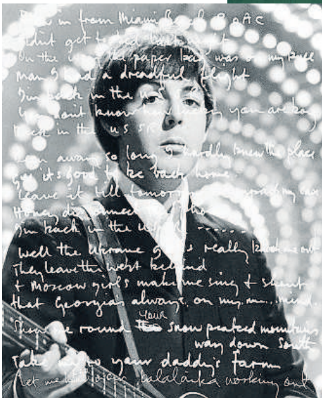
Paul McCartney ha compilado, y comentado, en los dos volúmenes de 'Letras', todo su cancionero