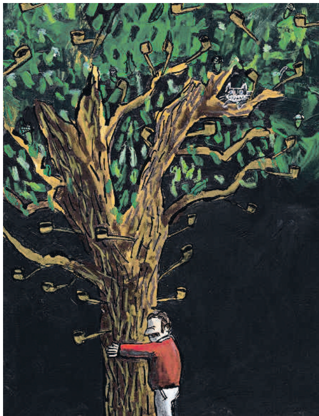
Ilustración de Emilio Urberuaga para la canción 'Arrimado a mí árbol', de Brassens