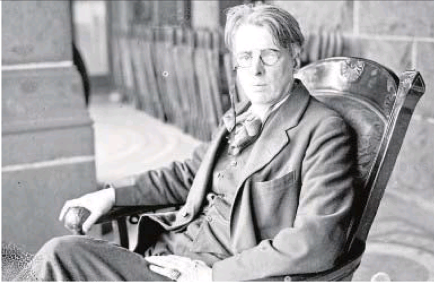
William Butler Yeats (Dublín, 1865-Roquebrune-Cap-Martin, Francia, 1939)