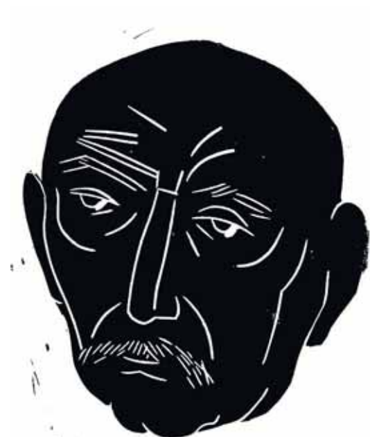
El poeta que volvía a Santander cada verano.