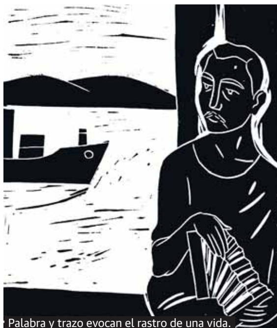
Palabra y trazo evocan el rastro de una vida.

es la nueva entrega del autor de 'Las bibliotecas perdidas'. Marchamalo (Madrid, 1960) ha desarrollado gran parte de su carrera en Radio Nacional de España y Televisión Española. Premio Ícaro y Nacional de Periodismo Miguel Delibes, entre otros, es autor de más de una decena de libros, entre otros, 'La tienda de palabras', '39 escritores y medio', 'Los reinos de papel' y 'La conquista de los polos'. Una trayectoria marcada por su querencia por reivindicar el mundo del libro y la lectura.