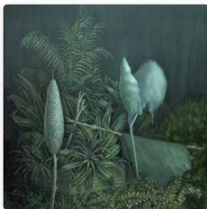
Regalado, Romero y la soledad que buscamos