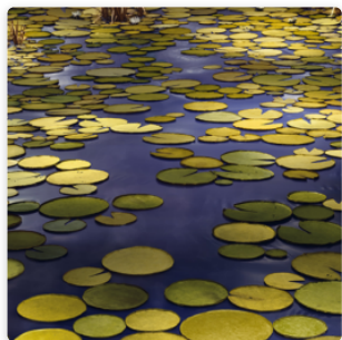
De cartón y experiencia: los mundos de Demand