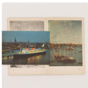
Suso Fandiño y el valor historiográfico del objeto