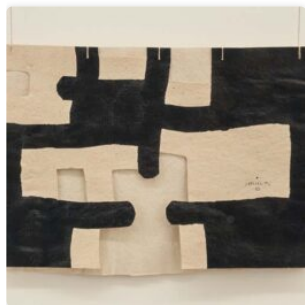
Chillida gravitando: espacio en lugar de cola