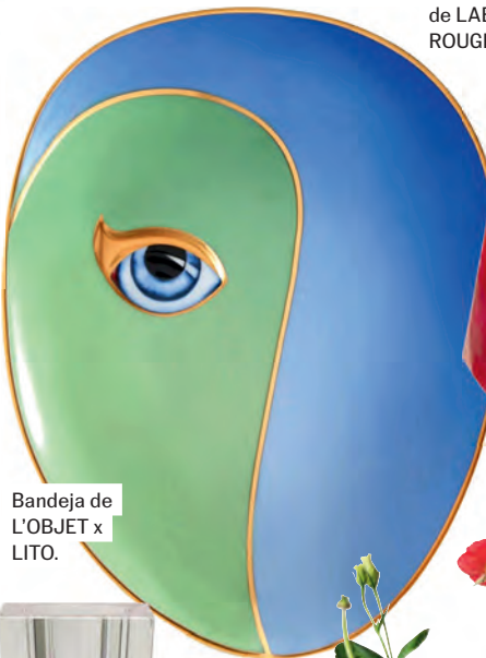
Bandeja de L'OBJET x LITO.