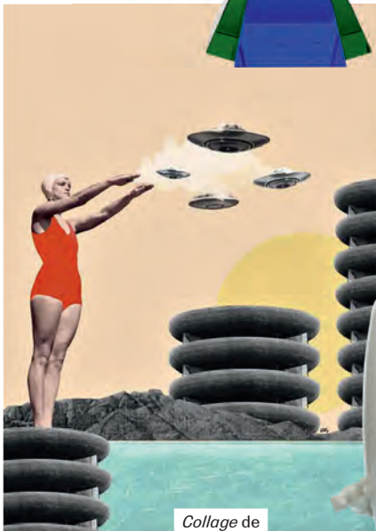
Collage de la artista LARA LARS.

La casa se erige como vitrina de detalles hedonistas, piezas con mensaje y pequeñas obras de arte que conectan con el mañana.