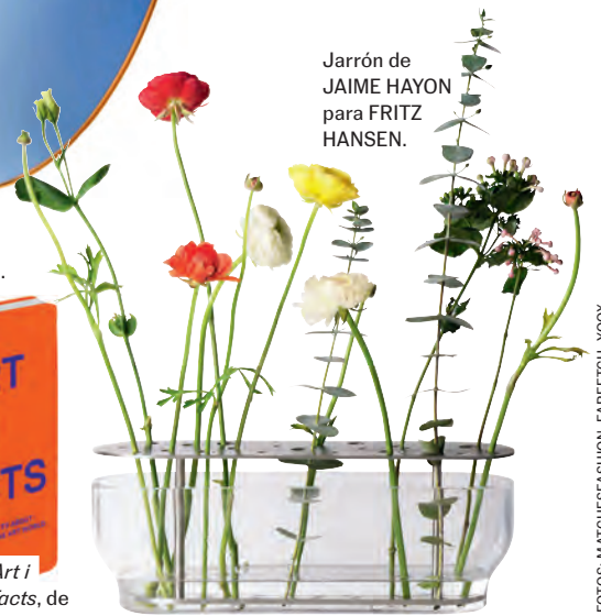
Jarrón de JAIME HAYON para FRITZ HANSEN.