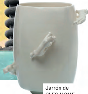
Jarrón de CLEO HOME por CUCKOO B.