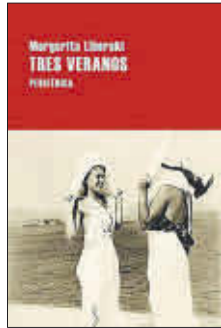
Tres veranos Margarita Liberaki Editorial Periférica 20,50 €

El gran clásico de las letras griegas del siglo XX. Tres veranos es el amplio retrato de una feminidad diversa, compleja y contradictoria. Una historia que encierra todo el encanto de aquellos momentos que inadvertidamente acaban convirtiéndose en los decisivos de una vida cuando se echa la vista atrás. Conmovedora, inocente, nostálgica y bellamente presentada.