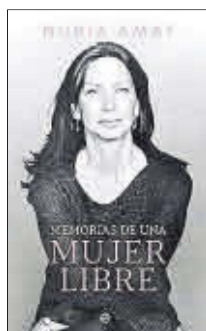
Memorias de una mujer libre Nuria Amat La Esfera de los Libros 23,90 €

No es la primera vez que Nuria Amat utiliza una estructura memorística para relatar momentos de su vida. En este caso recalca en el aspecto más político y vinculado con Catalunya. Casi 40 años de anécdotas y situaciones vividas que explican, no solo sus momentos personales, sino también el transcurso de su sociedad: en concreto la barcelonesa. Y todo para sentirse una mujer libre.