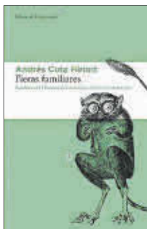
Fieras familiares Andrés Cota Hirriart Editorial Libros del Asteroide 20,95 €