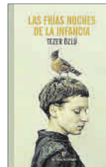
Las frías noches de la infancia Tezer Özlü Editorial Errata Naturae 14,00 €