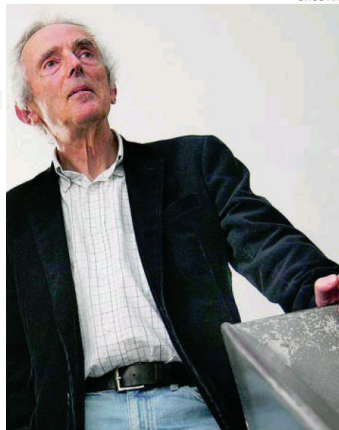
Peter Burke estudió numerosas disciplinas en Oxford