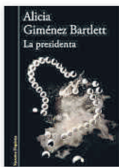
Alicia Giménez Bartlett La presidenta Alfaguara