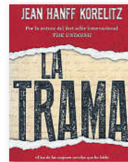
Jean Hanff Korelitz La trama