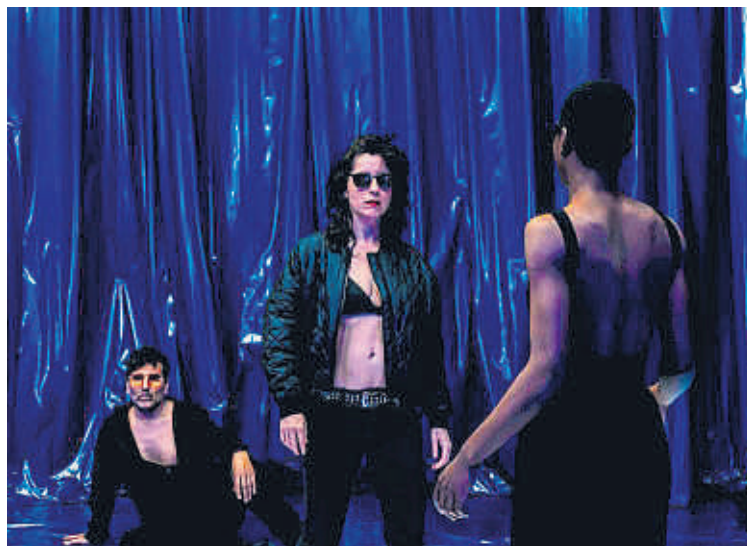
EL CONDE DE TORREFIEL

Encara que facin fora el visitant del museu, no deixarà de ser-hi. La peça del Conde de Torrefiel és una invitació a somiar desperts i a fugir de la imaginació delegada, la que ens proporciona