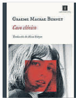
Graeme Macrae Burnet Caso clínico

sidenta de la Generalitat Valenciana que va ser trobada morta a l'habitació d'un hotel de Madrid. La casualitat fa que un atac al cor acabi amb la vida de Vita just el dia abans que hagi de comparèixer davant dels tribunals per declarar en un cas de corrupció que pot enfonsar el seu partit. Els mecanismes del poder es posen en marxa per fer passar per mort natural el que és un assassinat. La típica jugada d'encolomar a unes inspectores aprenentes –les germanes Miralles– la investigació no els surt bé. Fins i tot l'excessiva, controvertida, populista i, al cap i a la fi, dona sola i traïda que és Vita Castellà mereix l'única reparació possible: la veritat.