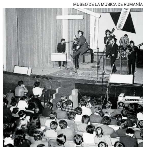
Un grupo de rock celebra un concierto durante los últimos años de la dictadura en Rumanía