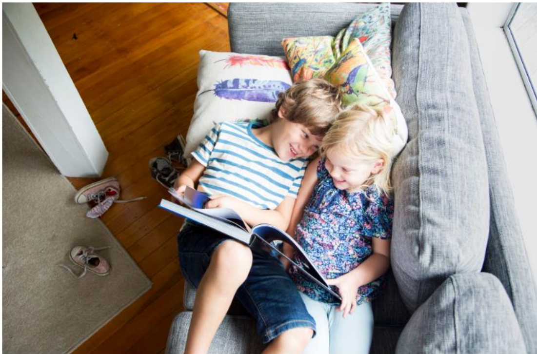
Dois niños leen y se divierten en su casa.

La Feria del Libro de Madrid ha acabado, pero son muchas las novedades que se han quedado en el tintero. Recopilamos una decena de títulos para leer en casa y combatir con humor las altas temperaturas