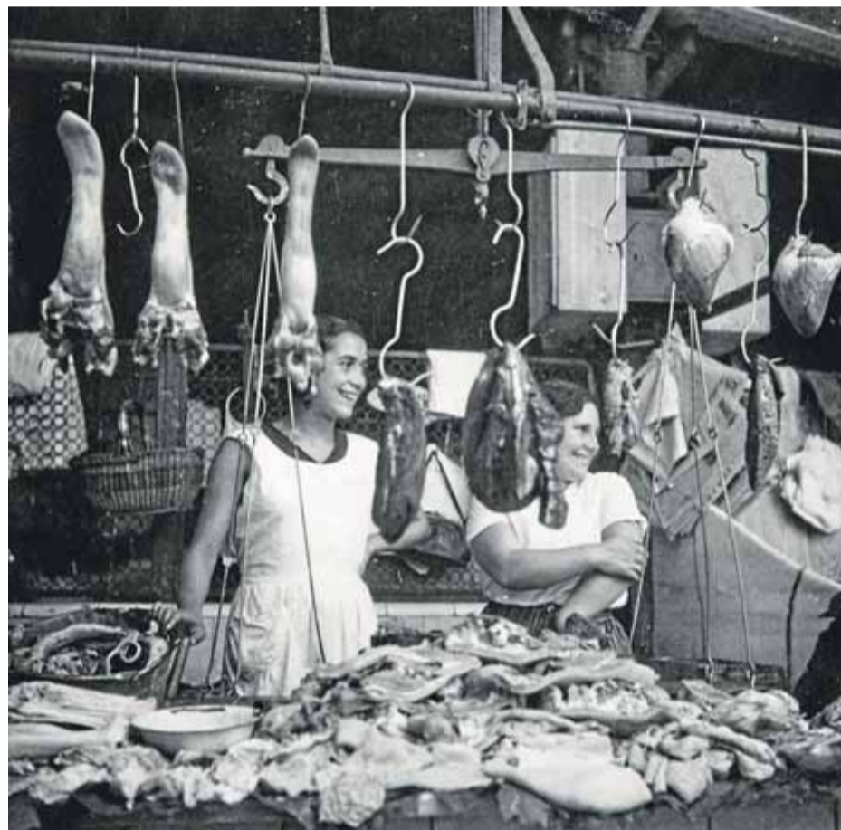
La mirada de la fotògrafa parisenca del mercat de la Boqueria ■ DORA MAAR

Picasso (encara casat amb Olga Koklova, mare