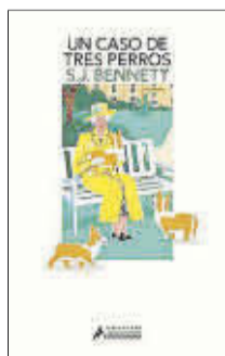
Un caso de tres perros S. J. Bennett Salamandra 19 euros

En esta continuación de El nudo Windsor , en el que Isabel II investigaba un misterioso asesinato, la monarca debe descubrir la relación entre un cuadro desaparecido y la muerte de la gobernanta de palacio, cuyo cuerpo es hallado junto a la piscina. Al fin y al cabo, a veces se necesita la afinada mirada de una reina para ver las conexiones que se le escapan al común de los mortales.