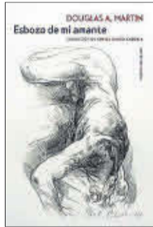
Esbozo de mi amante A. Martin SextoPiso 14,90 euros

Un joven estudiante de literatura, bello y seductor, se obsesiona con una estrella del rock veinte años mayor que acaba de mudarse a su ciudad. Cuando se conocen, ambos inician una relación tan pasional como tortuosa, marcada por la profunda asimetría de sus respectivas situaciones vitales, por lo que muy pronto la culpa y el resentimiento se apoderan de la relación.