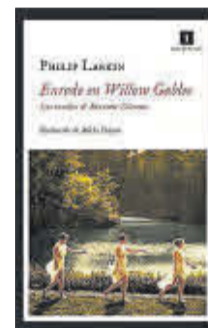
Enredo en Willow Gables Philip Larkin Impedimenta 23,50 euros