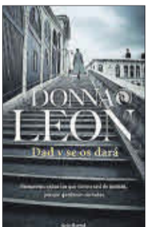
Dad y se os dará Donna Leon Seix Barral 19 euros