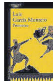
Prometeo Luis García Montero Alfaguara 17 euros

En esta continuación de El nudo Windsor , en el que Isabel II investigaba un misterioso asesinato, la monarca debe descubrir la relación entre un cuadro desaparecido y la muerte de la gobernanta de palacio, cuyo cuerpo es hallado junto a la piscina. Al fin y al cabo, a veces se necesita la afinada mirada de una reina para ver las conexiones que se le escapan al común de los mortales.