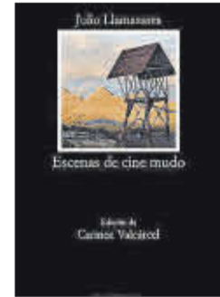
Escenas de cine mudo Julio Llamazares Cátedra 15,50 euros

Escenas de cine mudo reconstruye, a partir de recuerdos y de evocaciones, el personalísimo mundo de infancia de su narrador. Un conjunto de cuadros a partir de los cuales, como si se tratara de un montaje cinematográfico, se nos presentan los restos fragmentarios de una realidad que fue o que podría haber sido, y que todavía puede revivirse imaginaria o literariamente.