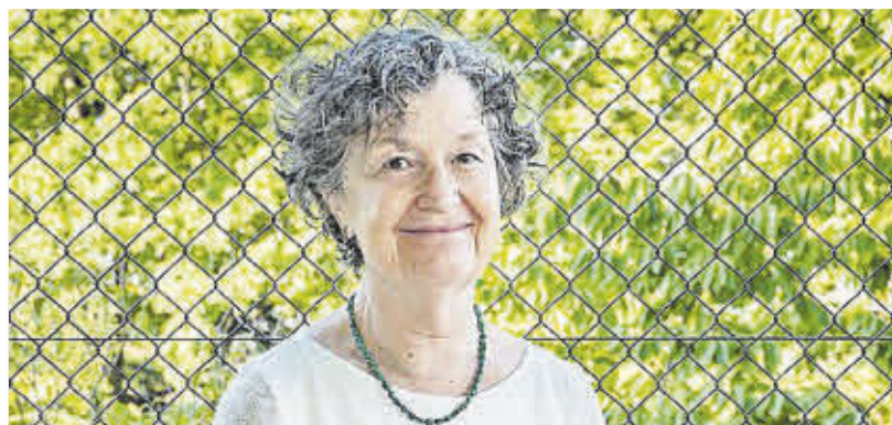
Maria Barbal.