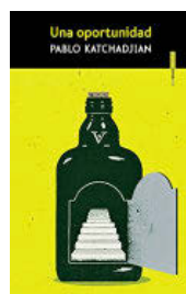
PABLO KATCHADJIAN UNA OPORTUNIDAD Sexto Piso. 144 páginas. 16,90 €