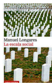
MANUEL LONGARES LA ESCALA SOCIAL Galaxia Gutenberg. 96 páginas. 13,50 € Ebook: 8,99 €

to, para qué. Eso sí: Longares sabe construir frases que no se agotan cuando se acaban, palabras que quedan resonando, oraciones eufónicas que brillan. Casi todo en La escala social sucede en el lenguaje, cuidado y sabio, y no en sus tramas, banales. Encontramos en ellas lo que suelen traer los microcuentos: paradojas, inversiones, alegorías, reformulaciones de episodios mitológicos o bíblicos, explicaciones alternativas a sucesos históricos, bromas... Es decir, muy poco.