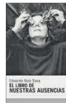
El libro de nuestras ausencias Eduardo Ruiz Rosa Candaya. 20 euros

El libro de nuestras ausencias es un relato sobre las desapariciones en el norte de México, la violencia del narcotráfico y las fosas clandestinas en el desierto y la sierra. Un recorrido de múltiples voces e historias, de tiempos que se solapan y se entretajan. La historia íntima de algunas ausencias, de las madres que buscan a sus hijos, de espacios que han de transformarse para seguir existiendo.