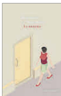
La brecha Mercedes Valdivieso Firmamento Editores 19 euros

La primera novela de Borja Bagunyà, premio de la Crítica 2022, está cargada de un humor despiadado y corrosivo, y supone la confirmación de una de las voces más llamativas y originales de la nueva narrativa catalana. Obcecado en las rencillas de claustro y el politiquero para ascender en a Universitat de Barcelona, Antoni Morella intenta dar con el artículo que desde hace un tiempo se le resiste.