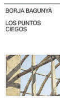
Los puntos ciegos Borja Bagunyà Malas Tierras 27,50 euros

La primera novela de Borja Bagunyà, premio de la Crítica 2022, está cargada de un humor despiadado y corrosivo, y supone la confirmación de una de las voces más llamativas y originales de la nueva narrativa catalana. Obcecado en las rencillas de claustro y el politiquero para ascender en a Universitat de Barcelona, Antoni Morella intenta dar con el artículo que desde hace un tiempo se le resiste.