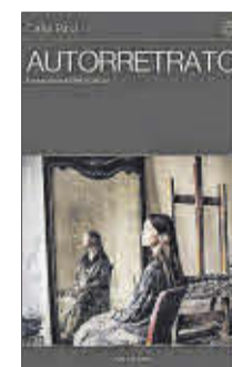
Autorretrato Celia Paul Chai Editora 19,50 euros

Autorretrato es el primer libro de la artista Celia Paul, nacida en la India en 1959. En él retrata la escena artística de Londres en los años 80, dominada por figuras masculinas como Lucian Freud, Frank Auerbach y Francis Bacon. Los relatos acerca de sus experiencias, los poemas y las entradas de diario de aquel entonces se completan con obras de todos ellos y suyas propias.