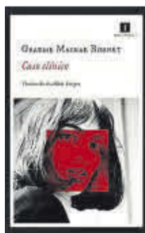
Caso clínico Graeme Macrae Burnet Impedimenta 23,95 euros

Macrae recibe una carta que le informa de la existencia de unos cuadernos relacionados con un controvertido psicoterapeuta. Curioso, se sumerge en ellos y descubre la historia de una mujer convencida de que su hermana se suicidó persuadida por este psicoterapeuta, que la trató: A. Collins Braithwaite. En busca de la verdad, la mujer asume una identidad falsa y acude a su consulta.