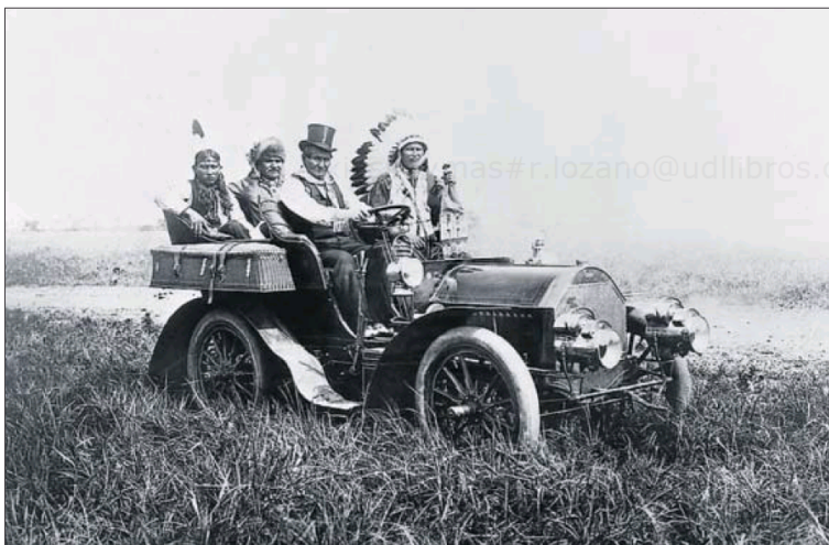
El jefe apache Gerónimo (al volante), en 1904 junto a otros tres nativos.

Interesantes propuestas en Debate, con El yo soberano, ensayo sobre las derivas identitarias , una reflexión sobre las políticas de la identidad y sus asignaciones a cargo de la conocida estudiosa de Freud y Lacan Elizabeth Roudinesco, y la apasionante biografía canónica del director del proyecto Manhattan y alumbreador de la era atómica Robert Oppenheimer, Prometeo americano , de Karl Bird y Martin J. Sherwin; libro ga-