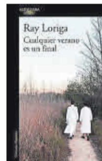
Cualquier verano es un final Ray Loriga Alfabara. 19,90 euros

Es esta una novela en la que Ray Loriga habla de la muerte brindando por la vida. Lo hace narrando los abismos de personajes (alguien viaja; alguien quiere amar; alguien ilustra libros) que forman parte de una sinfonía sobre la amistad, el amor y el final de la juventud. Un libro sobre el verano que todavía nos queda por disfrutar antes de que llegue el invierno.