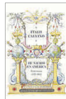
He nacido en América Italo Calvino Siruela 28,95 euros

El 15 de octubre de este año que acaba de comenzar celebraremos el centenario del nacimiento del gran Italo Calvino. La editorial Siruela, su casa en España, ya se ha lanzado a conmemorarlo con la publicación de He nacido en América , serie de entrevistas con el periodista y escritor italiano repartida a lo largo de cuatro décadas (1951-1985) que se lee como una autobiografía en construcción.