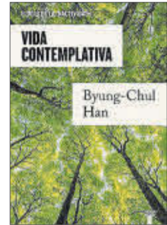
Vida contemplativa Byung-Chul Han Taurus 14,90 euros

El filósofo Byung-Chul Han, uno de los más seguidos por las jóvenes generaciones, indaga en su última obra publicada en España en los beneficios, el esplendor y la magia de la ociosidad y diseña una nueva forma de vida, que incluye momentos contemplativos, con la que afrontar la crisis actual de nuestra sociedad y frenar nuestra propia explotación y la destrucción de la naturaleza.