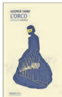
L'Orco George Sand Nórdica 9,95 euros

Para arrancar 2023, la editorial Nórdica recupera L'Orco , una pequeña delicia (64 páginas), inédita en castellano, de Amantine Aurore Dupin, conocida por el seudónimo de George Sand y quien fue una de las escritoras francesas más notables de la historia. Una autora de espíritu rebelde y libertario que al final de su vida se dedicó a proteger a literatos jóvenes como el mismísimo Gustave Flaubert.