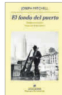
El fondo del puerto Joseph Mitchell Anagrama 19,90 euros

El fondo del puerto reúne seis piezas escritas por Joseph Mitchell para The New Yorker entre 1940 y 1950. En ellas, el reportero describe las zonas portuarias, el río Hudson y el East River, el mercado de pescado, las instalaciones para el cultivo de ostras, un viejo cementerio en Staten Island, barcazas, gabarras, barcas de pesca y personajes únicos como Sloppy Louie, el dueño de un restaurante.