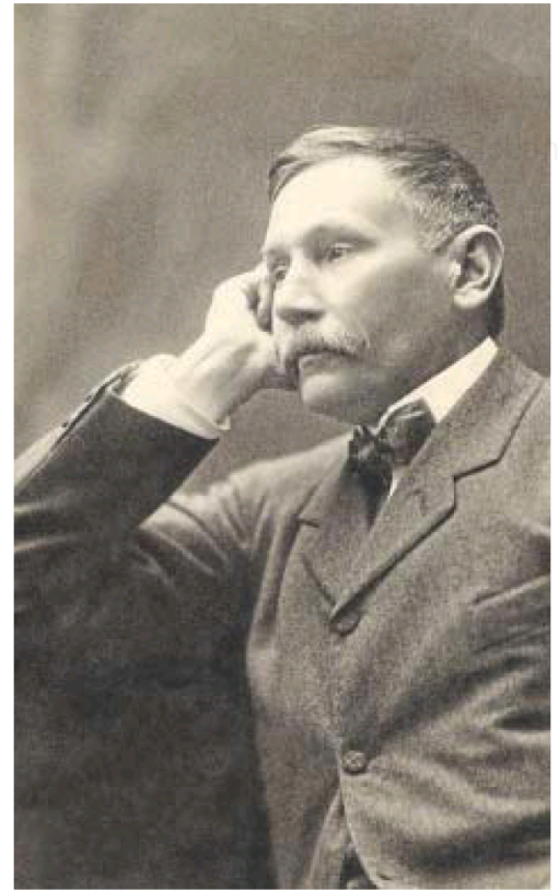
Emilia Pardo Bazán y Benito Pérez Galdós, en dos retratos de principios del siglo XX