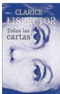
Todas las cartas Clarice Lispector Siruela 46,95 euros

Con una prosa arrolladora, sensible, poética y comprometida, Marie-Claire Blais, fallecida en noviembre de 2021, coloca al lector ante la brutalidad y la hostilidad que históricamente han padecido las personas queer en esta novela, publicada poco antes de su muerte. Entre tanto dolor, la autora logra que vislumbremos destellos de belleza, amor y sensualidad para celebrar la vida como una fiesta.