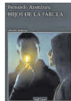
Hijos de la fábula Fernando Aramburu Tusquets 20,90 euros

Tras el éxito de Patricia , Fernando Aramburu vuelve a ubicar la acción de su nueva novela, Hijos de la fábula , en el entorno de ETA. En este caso, la acción transcurre en 2011. Joseba y Asier, dos jóvenes exaltados, se marchan al sur de Francia para convertirse en militantes de la organización terrorista. Pero, mientras esperan instrucciones, se enteran de que la banda ha anunciado el cese de la actividad armada.