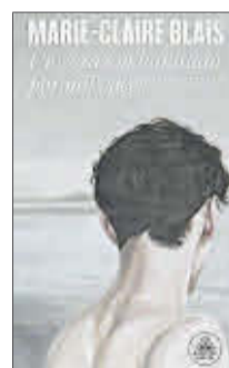
Un corazón habitado por mil voces Marie-Claire Blais Random House. 20,90 euros

En Mi casa está donde estoy yo , Igiaba Scego traza, a partir de sus recuerdos y de las historias que su madre le contaba de niña, un mapa de su memoria, marcada por los lugares de la ciudad donde nació y aún habita, Roma, y del país del que su familia partió exiliada, Somalia. Un viaje que recorre la época del colonialismo, la guerra civil somalí, la llegada de su familia a Italia y su infancia.