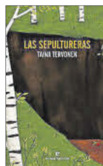
Las sepultureras Tania Tervonen Errata Naturae 21 euros