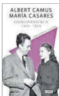
Correspondencia 1944-1959. Albert Camus y María Casares Debate . 48,90 euros

Albert Camus y María Casares vivieron una gran historia de amor que comenzó en 1948 y continuó hasta la muerte del escritor en enero de 1960. En medio de la vida pública y la actividad creativa de ambos, su correspondencia cruzada revela la intensidad de su relación íntima, que vivieron en la ausencia, en el disfrute de los días compartidos, en el trabajo conjunto y en la búsqueda del amor.