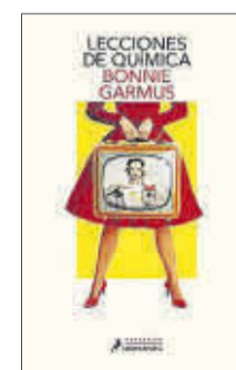
Lecciones de química Bonnie Garmus Salamandra 21 euros

Lecciones de química es una novela original y adictiva, la primera de su autora, la estadounidense Bonnie Garmus, que desentraña, con una protagonista deliciosa, Elizabeth Zott, de manera inteligente y entretenida, la espinosa cuestión de la igualdad de género, la necesidad de ser uno mismo y de por qué debemos negarnos a aceptar las limitaciones de los demás y tratar de imponer las nuestras.