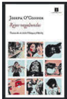
Reyes vagabundos Joseph O'Connor Impedimenta 23,95 euros

Reyes vagabundos es el testimonio de cómo nace y muere un grupo de rock: la historia de la esperanza ciega que lo alumbra y de las ambiciones que lo condenan. Una novela en la que Joseph O'Connor demuestra una profundidad y una gracia deslumbrantes, un conocimiento musical enciclopédico y una comprensión profunda y conmovedora del alma humana.