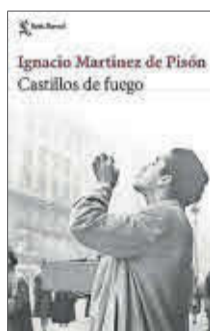
Castillos de fuego Ignacio Martínez de Pisón Seix Barral 22,90 euros

Darío Villanueva reúne en su nuevo libro, Poderes de la palabra , 12 capítulos que tratan de cómo la retórica sirve a la pura literatura, pero asimismo a la jurisprudencia, la política, la publicidad, el urbanismo o la invención –más que la recreación– de la propia existencia de las personas que escriben su autobiografía. Destaca la figura de Marshall McLuhan, que ha ejercido una enorme influencia.