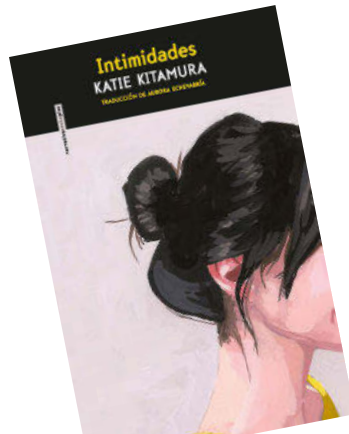
INTIMIDADES Katie Kitamura Sexto Piso

El 1 de marzo se publica la segunda novela de Juarma, que supuso toda una sorpresa con su primera, Al final siempre ganan los monstruos . Pluma antidoto de la idealización de los pueblos españoles que hemos vivido/sufrido en los últimos años, Juarma cuenta aquí la historia de un chico y una chica vecinos de un pueblito del que sueñan con escapar, algo que se revela como casi imposible. Una visión de las tripas de lo rural que hay que leer.