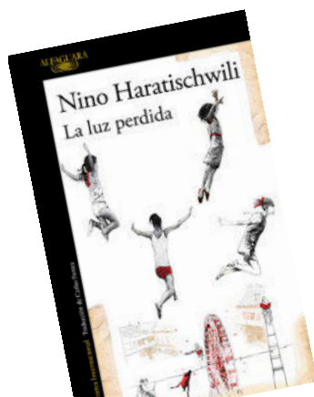
LA LUZ PERDIDA Nino Haratischwili Alfaguara

Esta obra, premio a Mejor Novela Inédita del Ministerio de las Culturas de Chile, es sobrecogedora. Planteada como el monólogo de una mujer que trabaja como empleada de hogar en la casa de una familia adinerada de Santiago de Chile, no solo radiografía las diferencias de clase sino también el abismo, y sus escalas, entre las expectativas y los sufrimientos de quienes no tienen nada pero lo dan todo y quienes lo tienen todo y no dan nada. Trágica y esencial.