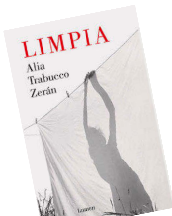
LIMPIA Alia Trabucco Zerán Lumen

Esta obra, premio a Mejor Novela Inédita del Ministerio de las Culturas de Chile, es sobrecogedora. Planteada como el monólogo de una mujer que trabaja como empleada de hogar en la casa de una familia adinerada de Santiago de Chile, no solo radiografía las diferencias de clase sino también el abismo, y sus escalas, entre las expectativas y los sufrimientos de quienes no tienen nada pero lo dan todo y quienes lo tienen todo y no dan nada. Trágica y esencial.