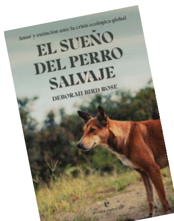
EL SUEÑO DEL PERRO SALVAJE Deborah Bird Rose Errata Naturae

Esta novela es, sencillamente, monumental. Y no solo por sus algo más de 700 páginas. Se trata de una auténtica epopeya cuyo protagonista es el devenir de cuatro niñas del mismo barrio en una Georgia agitada políticamente a finales del siglo XX. Considerada una de las mejores voces de la literatura alemana actual, Haratischwili ha facturado una obra de las que atrapan irremisiblemente, donde la vida más común se revela un drama de dimensiones épicas.