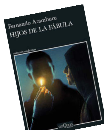
HIJOS DE LA FÁBULA Fernando Aramburu Tusquets

En su línea, que nunca defrauda a los amantes del nature writing , Errata publica estos días esta obra a medio camino entre las memorias y el ensayo intercultural, escrito por quien fuera antropóloga de fama mundial, figura central de los estudios sobre ecología. A partir del intento de erradicación de los dingos, los perros salvajes de Australia, plantea la necesidad de sustituir nuestra ética antropocentrista por una más interconectada con todos los seres vivos.