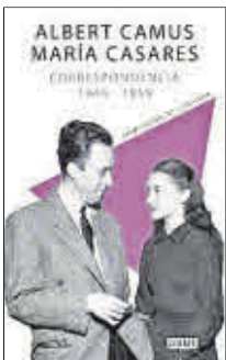
Correspondencia 1944-1959. Albert Camus y María Casares Debate . 48,90 euros

Albert Camus y María Casares vivieron una gran historia de amor que comenzó en 1948 y continuó hasta la muerte del escritor en enero de 1960. En medio de la vida pública y la actividad creativa de ambos, su correspondencia cruzada revela la intensidad de su relación íntima, que vivieron en la ausencia, en el disfrute de los días compartidos, en el trabajo conjunto y en la búsqueda del amor.