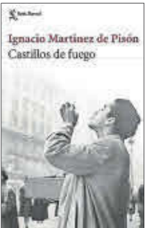
Castillos de fuego Ignacio Martínez de Pisón Seix Barral 22,90 euros

Ignacio Martínez de Pisón regresa con una ambiciosa novela coral, ambientada en el Madrid de 1919 a 1945. En ella mezcla una soberbia y documentada ambientación histórica con el fascinante devenir de un puñado de personajes inolvidables. Un libro que supone la culminación de una gran trayectoria literaria coronada por libros como La buena reputación , El día de mañana y Dientes de leche .