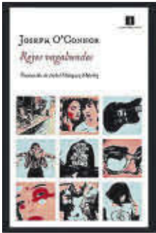
Reyes vagabundos Joseph O'Connor Impedimenta 23,95 euros

Reyes vagabundos es el testimonio de cómo nace y muere un grupo de rock: la historia de la esperanza ciega que lo alumbra y de las ambiciones que lo condenan. Una novela en la que Joseph O'Connor demuestra una profundidad y una gracia deslumbrantes, un conocimiento musical enciclopédico y una comprensión profunda y conmovedora del alma humana.