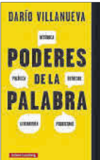
Poderes de la palabra Darío Villanueva Galaxia Gutenberg 22 euros

Darío Villanueva reúne en su nuevo libro, Poderes de la palabra , 12 capítulos que tratan de cómo la retórica sirve a la pura literatura, pero asimismo a la jurisprudencia, la política, la publicidad, el urbanismo o la invención –más que la recreación– de la propia existencia de las personas que escriben su autobiografía. Destaca la figura de Marshall McLuhan, que ha ejercido una enorme influencia.