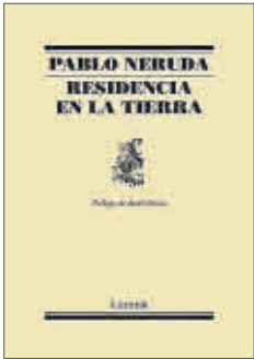
Residencia en la tierra Pablo Neruda Lumen 17,90 euros

Publicado inicialmente en 1933 y ampliado en 1935, Residencia en la tierra es el gran clásico del «más grande poeta del siglo XX en todos los idiomas», en palabras de Gabriel García Márquez. A raíz de una crisis vital durante su estancia consular en oriente, Pablo Neruda se embarcó en la composición de este libro monumental que supuso una ruptura respecto a su obra anterior y la poesía en español.