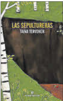
Las sepultureras Tania Tervonen Errata Naturae 21 euros

Dos mujeres cavando, miles de huesos sin nombre, una tierra inconsolable –Bosnia-Herzegovina– y una escritora valiente y lúcida. Las sepultureras recoge los restos del conflicto para construir un relato fulgurante, merecedor del prestigioso premio Jan Michalski 2022. Un libro conciso, demoledor, brillante y, en última instancia, sanador. En definitiva, una hazaña literaria.